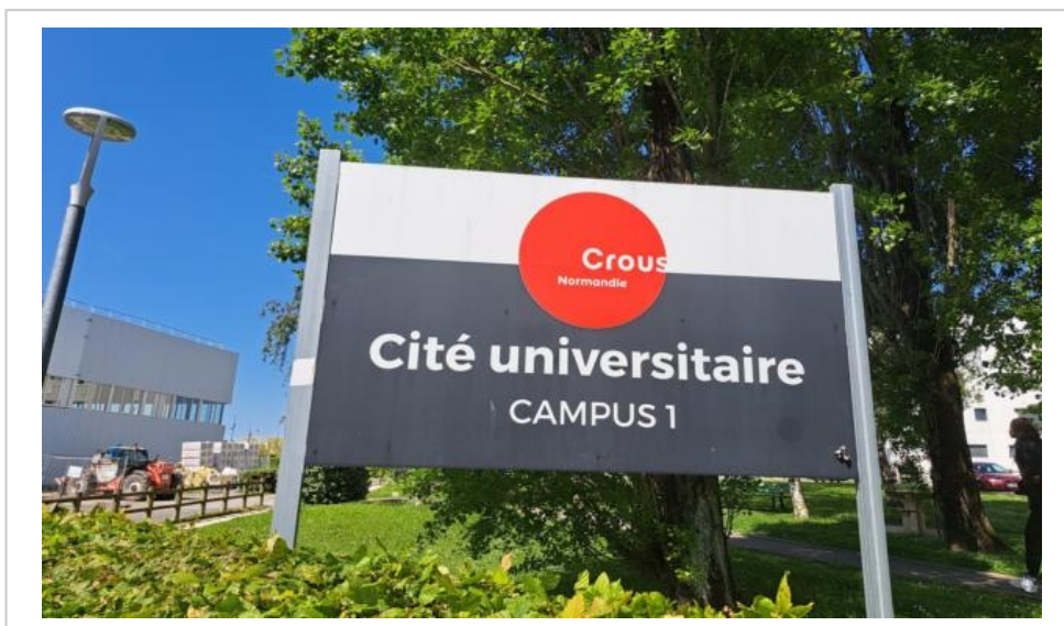
Les cités universitaires vont aussi connaître de nouvelles mesures avec la réforme des bourses.