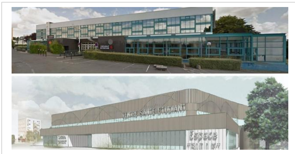
L'ancien restaurant universitaire B sur le campus 1 va être totalement transformé.

Le service patrimoine du Crous Normandie est chargé de l'exécution des travaux. Les études se termineront à la mi-août. Les travaux commenceront en novembre 2021 pour se terminer en septembre 2022.