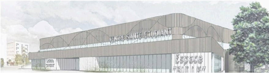
L'ancien restaurant universitaire B sur le campus 1 va être totalement transformé.

À l'automne 2022, les étudiants de l'Université de Caen découvriront un tout nouveau bâtiment. Le premier étage de l'ancien restaurant universitaire B, sur le Campus 1, va être transformé en centre de santé.